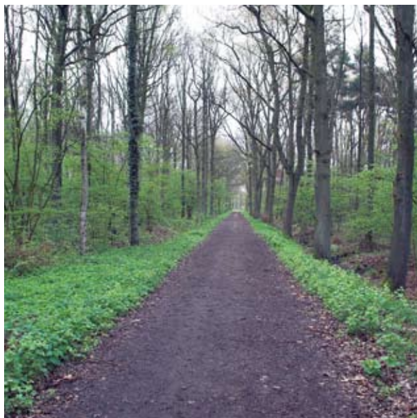
De Marggraffroute voert u afwisselend langs oude en jonge bomen.

Deze route verbindt beide parkeerplaatsen en is blauw gemarkeerd. Een fijne wandeling door een prachtig bosgebied van ongeveer 5 km (ca. 2 uur lopen). Het is een voor iedereen goed begaanbare wandelroute over de brede bosdreven. Via deze blauwe route kunt u aanhaken op de andere route, het laarzenpad. De route voert gedeeltelijk over het landgoed van Marggraff. Deze bossen worden al decennialang als strikt natuurbos beheerd; er is niet gekapt en de paden zijn langzamerhand door de natuur overwoekerd. Door het stille en ontoegankelijke karakter van de bossen is dit een rustgebied voor het wild. Een mooi voorbeeld hoe het ook in de bossen van Staatsbosbeheer moet worden.