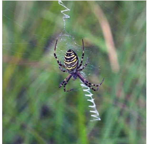
Zoek de zigzagdraad en vind de Wespspin.