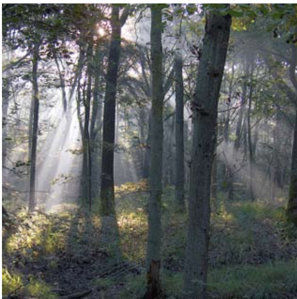
Prachtig wordt het licht gefilterd in de bossen van de Geelders.