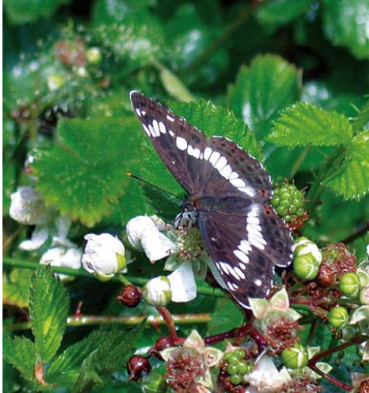
De kleine ijsvogelvlinder geniet van het nectar van de wilde braam.